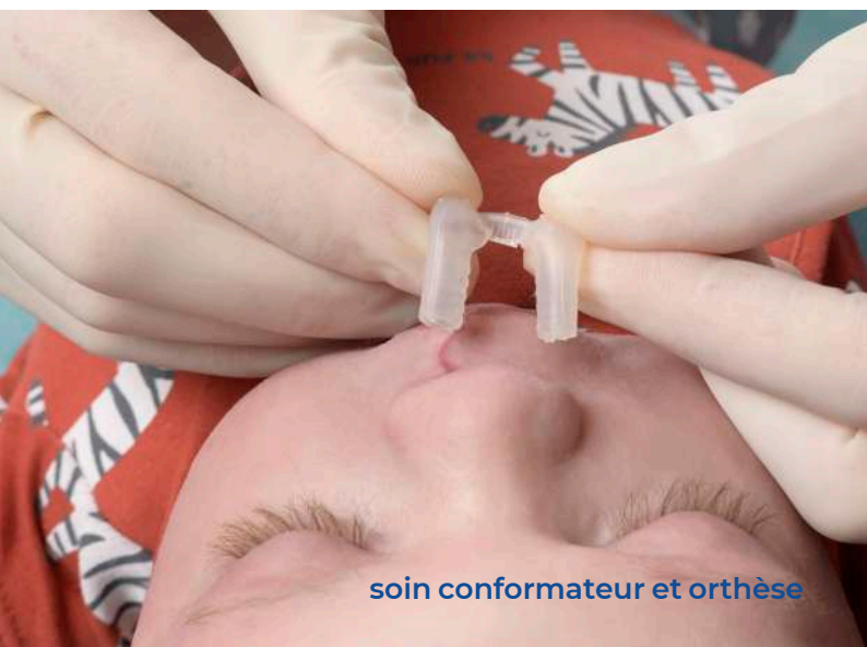
soin conformateur et orthèse